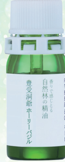
豊受の精油 洞爺ホーリーバジル

緊張と疲労にリラックス効果のあるカラマツの精油。免疫の強化、肺の活性。ナイーブなあなたを森林の香りがサポート。