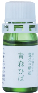
豊受の精油 青森ひば