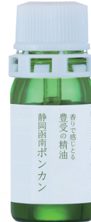
豊受の精油 函南ポンカン

日本古来の樹木の香り。鎮静、鎮痛、強壮、血行促進効果もあるそうです。自然にリラックス&リフレッシュ！