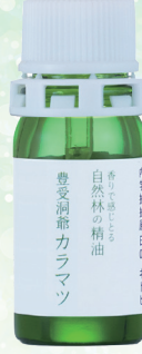
豊受の精油 洞爺カラマツ

第7チャクラに効果のあるトドマツの精油。トドマツの香り成分がスギ花粉をコーティングし、花粉のアレル物質の働きを低減することがわかっています。