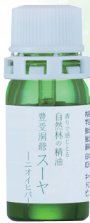
豊受の精油 洞爺スーヤ

強く、大きな、自己卑下の意識によって、自分は誰よりも優秀で、偉く、強く、賢いと思いついて疑われない人。そのように思わないと生きていけないプライドの高い人。人に対して負ける、駄目になることを絶対に許せない人が、人から評価されなくても、認めてもらえなくても、大丈夫なんだと思える勇気を与えてくれる。