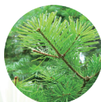
トドマツ蒸留水・精油