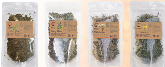
アーティカプラット